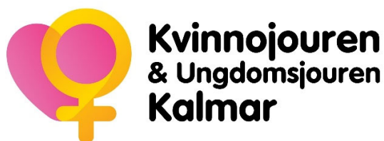
Kvinnojourens logotyp 2021

Årsmötet beslutade om ett namnbyte efter en inkommen motion. Resultatet blev en uppdatering av vår omtyckta logotype, som lanserades den 1 februari 2021.