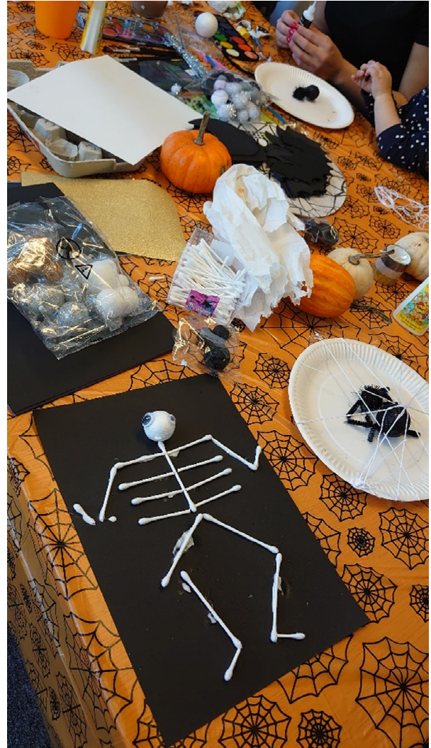
Bilder från vår Halloween-fest hösten -21