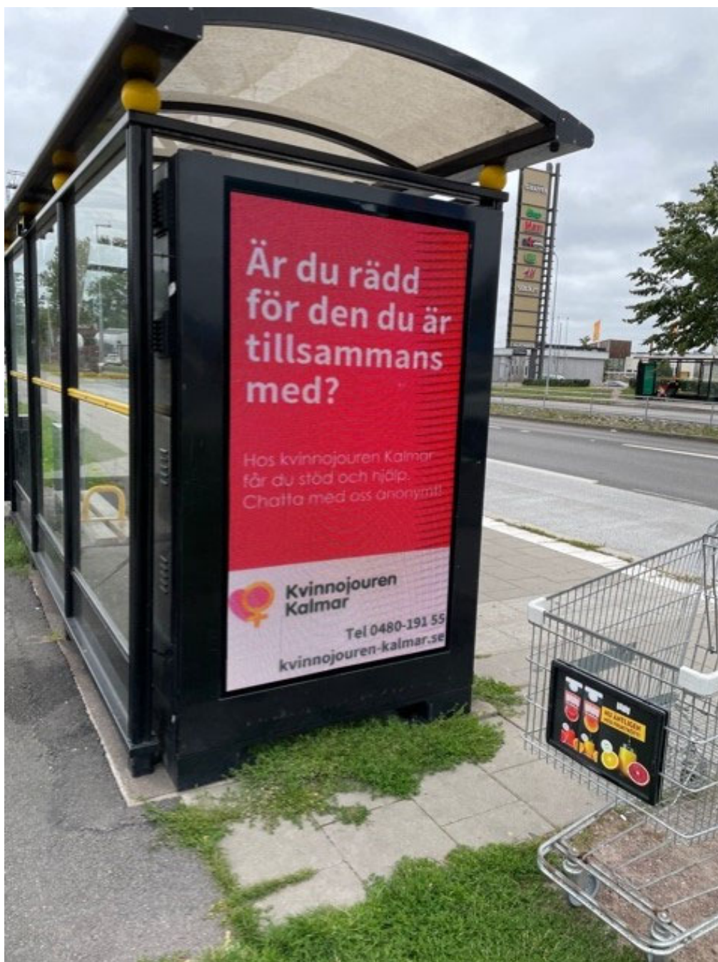
Marknadsföring i anslutning till KLT:s bussar

Marknadsföringsinsatserna har möjliggjorts genom beviljade bidrag från Brottsoffermyndigheten i första hand.