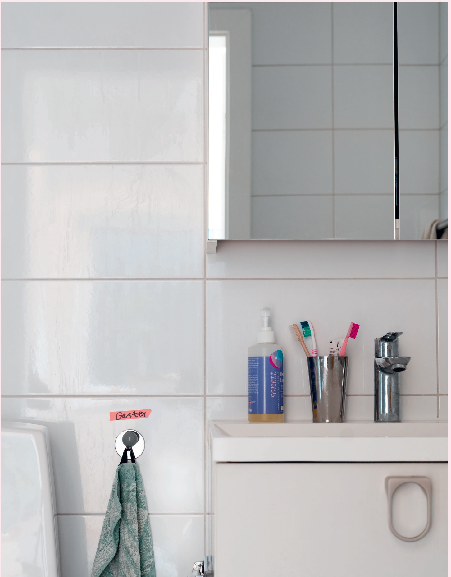
Kronan på verket är spegeln som aldrig visar blåmärken.