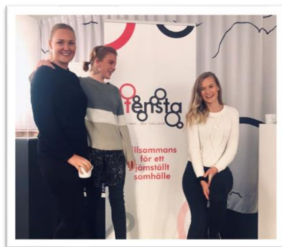
Bild till vänster från Nyhetsbyrå Järva, en artikel om vårt seminarium. Till höger, tre av våra volontärer från tjejjouren.