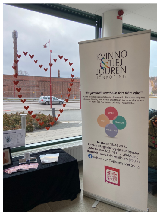
Utställning på Huskvarna bibliotek under En vecka fri från våld.

och ungdomsförvaltningen och med de jourkolor som jouren är knuten till genom den handlingsplan som finns med Jönköpings kommun är unik. Denna samverkan är mycket viktig för de barn som bor skyddat hos kvinno- och tjejjouren. Att skolgången kan fortsätta är en rättighet och möjlighet att få gå på fritids och förskolan kan göra stor skillnad för barnen. Kvinno- och tjejjouren har en representant i styrelsen för Länsförbundet Kvinno- och tjejjourer i Jönköping län där vi har en direkt samverkan med länets övriga jourer.