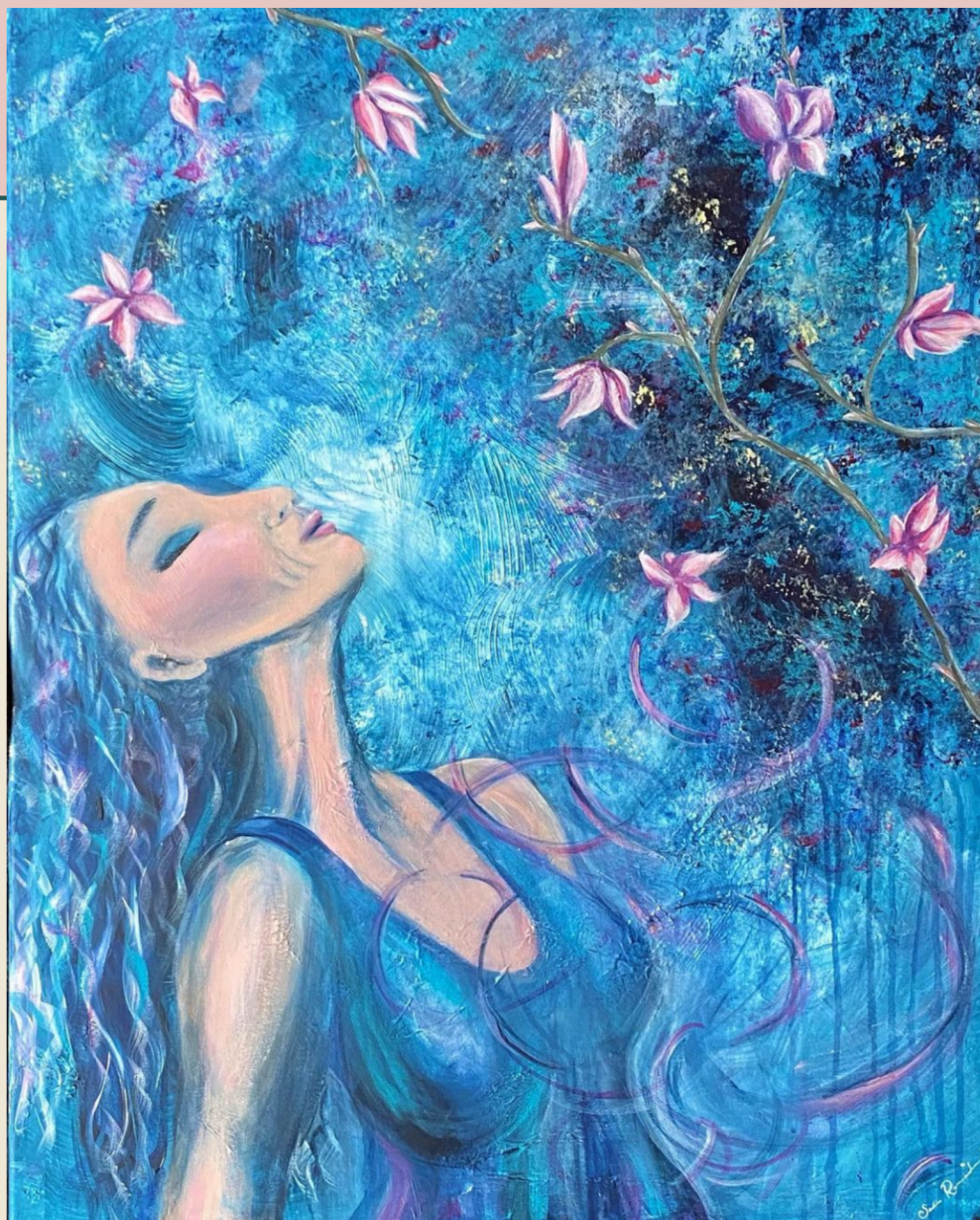
Konstnär: Sofia Romedahl

Inkluderad verksamhetsplan och övergripande målsättning för år 2024-2026