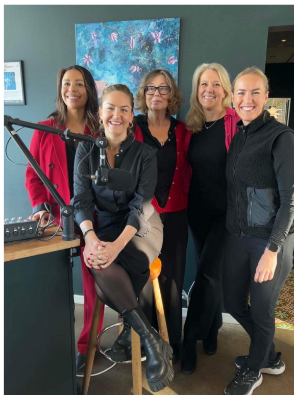
Adgrabber, Addpeople & Bryggan arrangerade frukostpodden och auktionen den 8 mars.